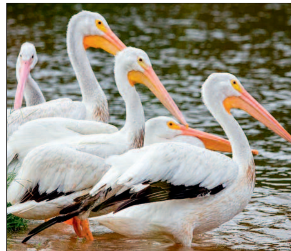
कैज आजू-बाजू है। गोवा, असम आदि में जलीय वनक्षेत्रों में रहने

अपने कैज के पानी के पोखर में जलक्रीड़ा करते इन परिटों को सैलानी अपने मोबाइल कैमरे में कैद कर रहे हैं। उल्लेखनीय है कि मैत्रीबाग में ग्रे पेलिकन प्रजाति के 9 और स्माल पेलिकन नस्ल के 7 बर्ड हैं। दोनों के