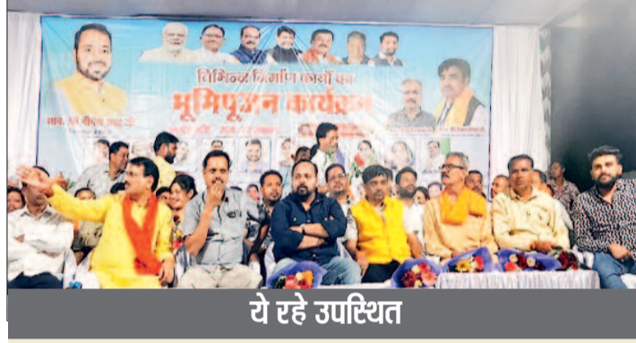
ये रहे उपस्थित

कार्यक्रम में बड़ी संख्या में स्थानीय नागरिकों की मौजूदगी रही, जिससे आयोजन में जनभागीदारी और उत्साह का माहौल देखने को मिला। नागरिकों ने विकास कार्यों की शुरुआत पर खुशी जताते हुए इसे